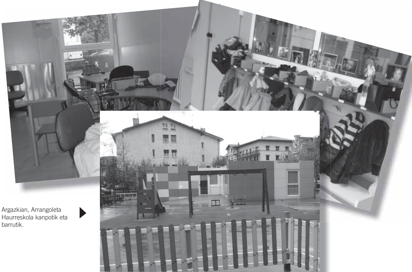
Argazkian, Arrangoleta Haurreskola kanpotik eta barrutik.

Haur eskolan orain arte egin diren obra guztiak hango hezitzaile eta gurasoen eskaeren eta lehentasunen arabera egin izan dira, eta oraingoan ere horrelaxe izango da.