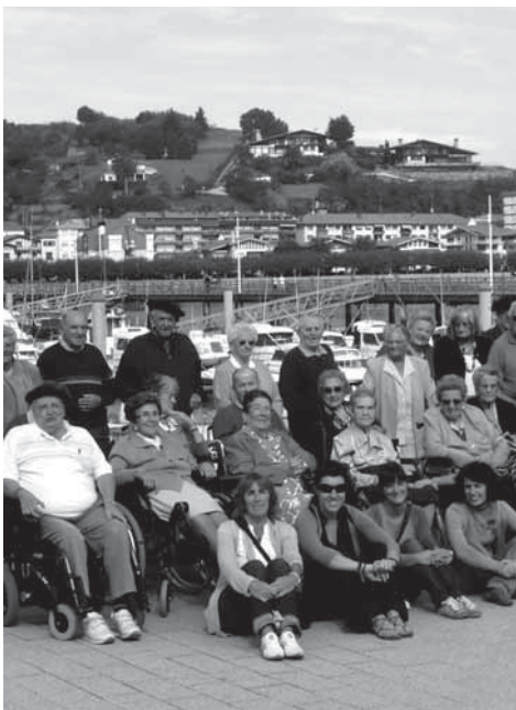
Irudian, San Juan Egoitzako kideak

San Juan egoitzako kideek ekintza asko egin dituzte azken hilabeteotan, horien artean, kanpoan egin dituzten meriendak, herriko txoko ugari ikusteko egindako bisitak, Algorri Interpretazio Zentrora egindako txangoa... Aisialdiko ekintzak eta ekintza kulturalak tartekatu dituzte irteeretan.