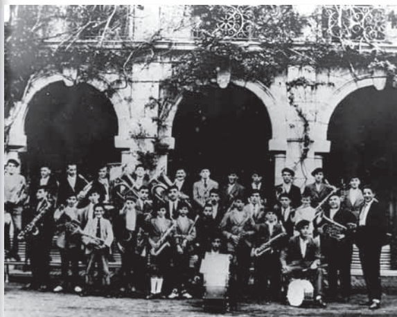
Musika Bandako talde erretratu Udaletxearen aurrean.

Niños remeros desfilando con el trofeo ganado.