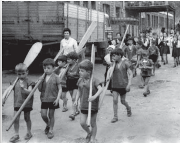
Mutiko arraunlari talde batek irabazitako trofeoarekin desfilean.

Argazki artxibo osoa www.euskomedia.org helbidean dago ikusgai.