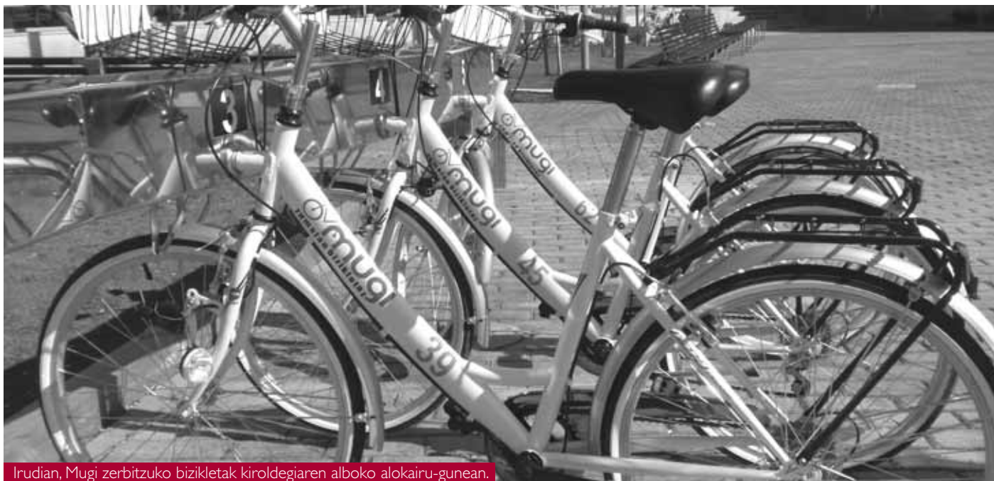
Irudian, Mugi zerbitzuko bizikletak kiroldegiaren alboko alokairu-gunean.

La experiencia piloto del servicio Mugi ha ofrecido al Ayuntamiento nuevas propuestas para afianzar el servicio.