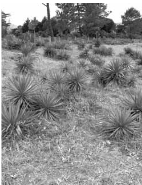
Irudian, Itzurungo hondartza Yucca kendu aurretik.

Zumaia Udaleko Ingurumen sailak Yucca Gloriosa landare inbaditzailea kentzeko kanpaina gauzatu berri du. Espezie hau Euskal Autonomi Erkidegoan oso murrizta den arren, Santiago hondartzako dunetan eragin nabarmena izaten ari da, eta hori dela eta erabaki du Udalak landare inbaditzaile honen garbiketa egitea. Era horretan 48 bat landare sustraitik atera eta gainerako guztiak errotik moztu dira.