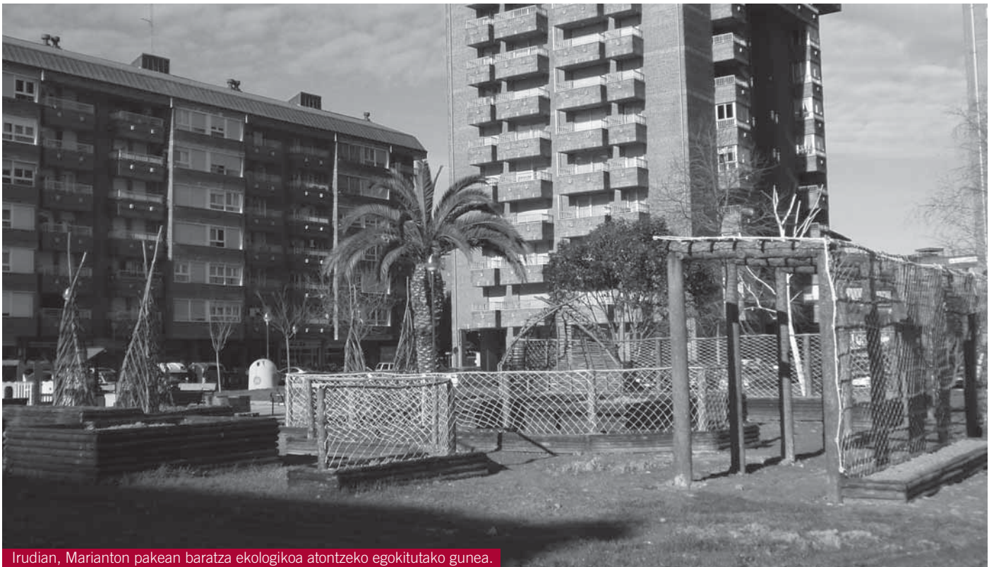
Irudian, Marianton pakean baratza ekologikoa atontzeko egokitutako gunea.

Z umaiaiko Udala herri-baratze ekologikoa prestatzen ari da Marianton parkean. Baratze didaktikoa izango da, eta Ingurumen Hezkuntzarako erabiliko da. Zumaiaiko Udalak herritarrei produkzio ekologikoaren inguruko informazioa zabaldu nahi die baratza horien bidez. Izan ere, baratze ekologikoa Ingurumen Hezkuntzarako “baliabide bikaina” dela uste du Udalak, eta herritarrei nahiz ikastetxeetako ikasleei “gure natur ingurunea ezagutzeko” eta “esperientzia