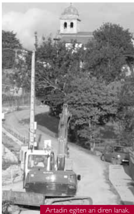
Artadin egiten ari diren lanak.

Aparkalekuen arazoari neurri batean erantzunez, Aita Mari auzoan 40 autorentzako aparkalekua egokituko da. “Ezertarako erabiltzen ez zen orube bat zegoen Aita Mari eta eremu hori egokituko dugu aparkalekuak sortzeko”, diote Udaleko teknikariek. Lehendabizi, zoladura berria jasateko beharrezko egitura ezaugarriak ez zituzten hormak erautsi egin ditu Udalak eta hormigoizko horma berriak eraiki dira horien lekuan. Horrek lur geruza trinkotu eta bere erresistentzia jasatea ahalbidetuko du. Instalazioak berrituko dituzte gero eta inguruko espaloiak eraberritu egingo dituzte. Udaleko teknikariek bideratu dute exekuzio honen obra zuzenda