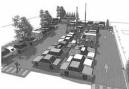
Aita Mariko aparkalekuaren proiektua.