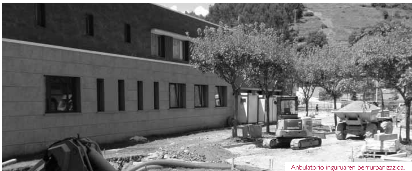
Anbulatorio inguruaren berrurbanizazioa.

El Ayuntamiento de Zumaia está realizando varios trabajos de adecuación en el municipio; se prevé que todos los trabajos estén finalizados para diciembre.