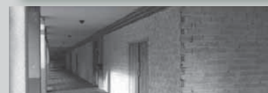
3- Itsas kirolentzako lokala