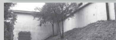
5- Artadiko ur-depositoa