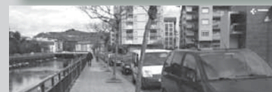
2- Basadi kalea