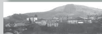
4- Oikia auzoa