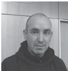
Xebax Leiza Txinparta euskara elkarteko kidea

“Eraikina eraberritu egin behar dugunez, horrek bere mugak ere baditu, baina estetikoki ederra geratuko da, aldi berean. Gainera, baliabide teknologiko berriekin egokituko dugu eraikina. Solairu guztietan edukiko dute herritarrek interneterako sarbidea”.