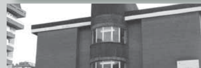
7- Julene ikastetxeko estalpea