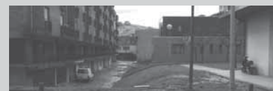
1- Aita-Mariko aparkalekua

El Ministerio de Administraciones Públicas del Gobierno español dará a conocer las decisiones el 17 de febrero. Las obras se adjudicarán antes del 13 de marzo y la tirada de cuerdas o todos los documentos oficiales para comenzar la obra estarán listos antes del 13 de abril.