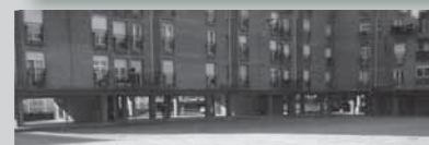
6- Aita-Mari auzoa