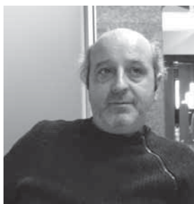
Inazio Tolosa Antzerkigilea

“Emaizta ez da izan gure gustukoa baina parte hartu duten gainontzeko taldeek hori erabaki zuten eta guk hori positiboki baloratzen dugu. Ez da izan inposatutako proiektu bat”.